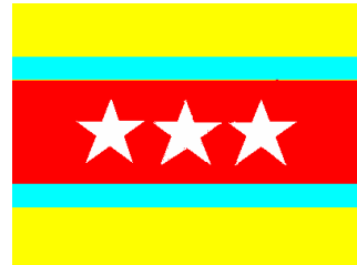
QUỐC Kỳ CỘNG HÒA BÌNH XÃ THIÊN VIỆT Từ đầu năm 2015