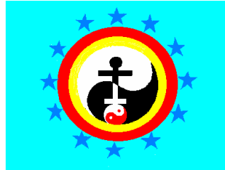
GIÁO Kỳ THIÊN NHÂN ĐẠO THIÊN NHÂN VIỆT GIÁO Từ năm Bính Tuất 2006